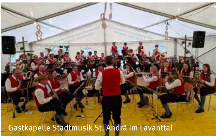
Gastkapelle Stadtmusik St. André im Lavanttal