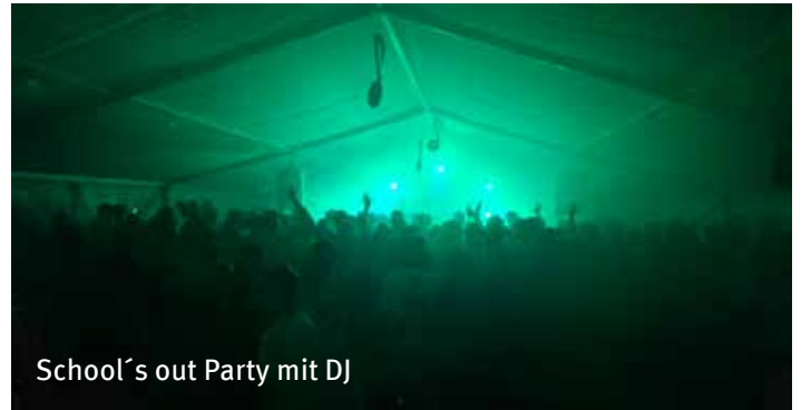
School's out Party mit DJ