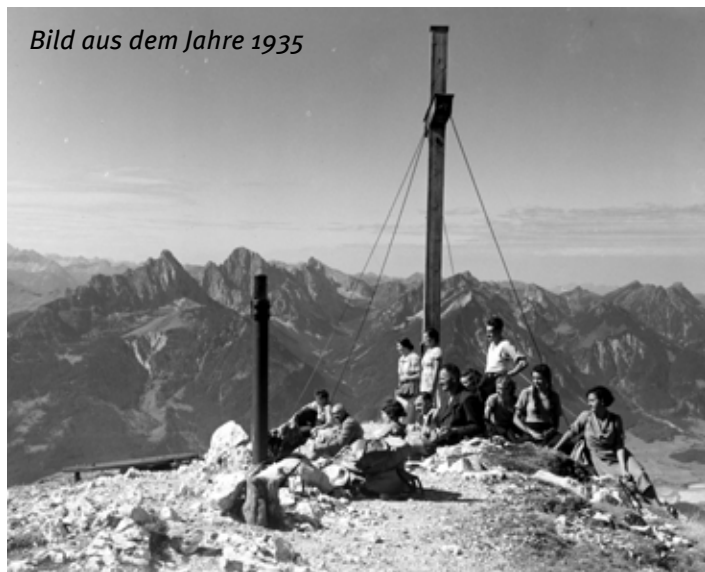
Bild aus dem Jahre 1935