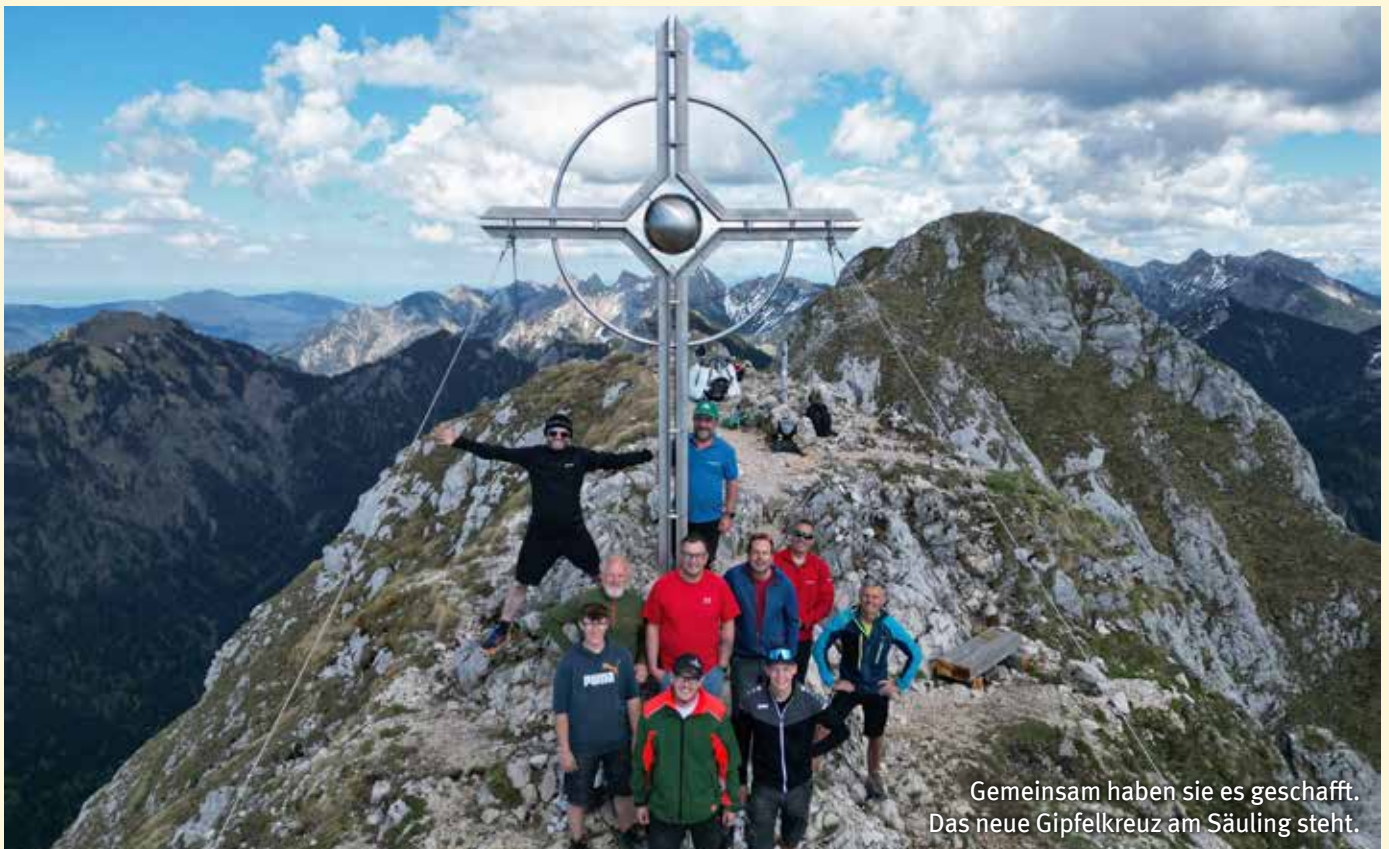
Gemeinsam haben sie es geschafft. Das neue Gipfelkreuz am Säuling steht.