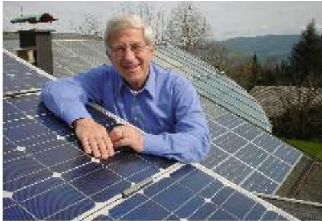
Dr. Franz Alt gilt als einer der großen Solarpioniere in Deutschland.

Franz Alt ist vielen noch bekannt als Fernsehjournalist. Er war zwanzig Jahre Leiter und Moderator der Sendung »Report« und bis 2003 Leiter der Zukunftsredaktion des Südwestrundfunks sowie Moderator der Magazine »Grenzenlos« und